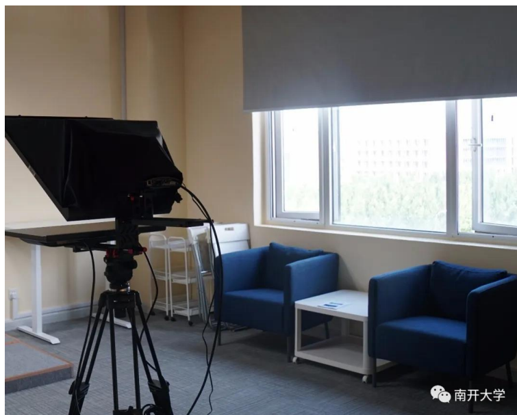
图 2：教师休息讨论区 用于课程录制中间的休息及教师之间的探讨交流